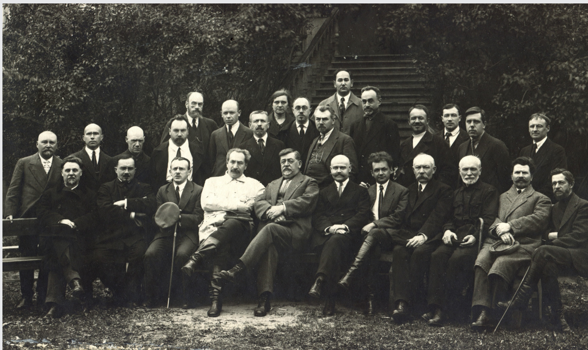
Профессорско-преподавательский состав медфака НГУ, 1925 г.