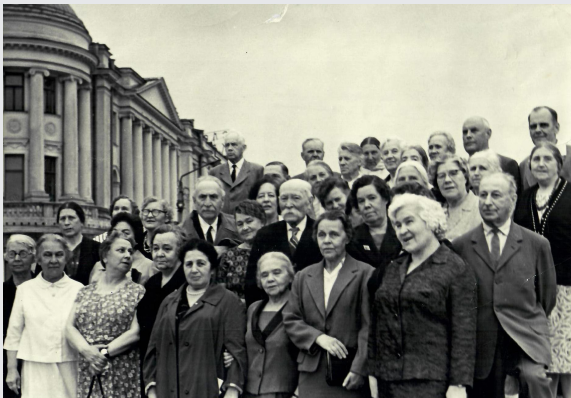
Встреча выпускников медфака 1925 г. с преподавателями через 40 лет, 25 июня 1965 г.